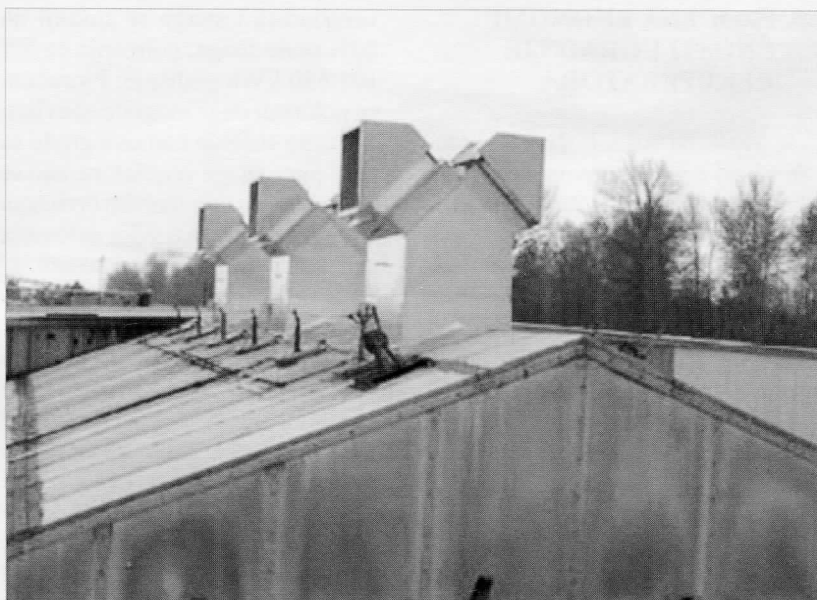
Slika 1: Rekuperatori na krovu sušare Figure 1: Recuperators on the roof of the kiln

Takvi sistemi su energetski neefikasni jer se velika količina toplote gubi kada se topao, vlažan vazduh odstrani iz sušare, dok se istovremeno troši dodatna energija na zagrevanje svežeg vazduha koji je doveden spolja. Vlažan vazduh je još uvek topao kada se odstranjuje iz sušare. Ako bi se ta toplota iz vlažnog vazduha na neki način