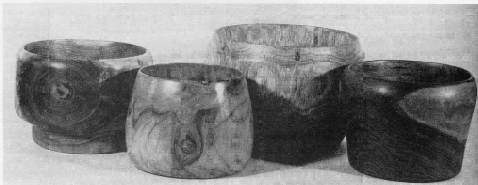
Slika 3: Posude tretirane PEG-om tokarene iz sirovih trupčica

Nije moguće dati precizne režime za natapanje drveta PEG-om zbog velikog broja varijabli, naročito