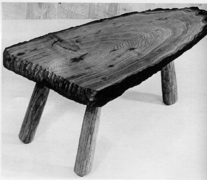
Slika 1: Rustični sto napravljen od drveta nepravilne strukture sa korom Figure 1: Rustic table made from wood of irregular structure with bark

PEG se takođe može koristiti kao agens za pripremu za sušenje drveta. Relativno blag tretman može efikasno da spreči oštećenja koja bi nastala sušenjem sirovog drveta,