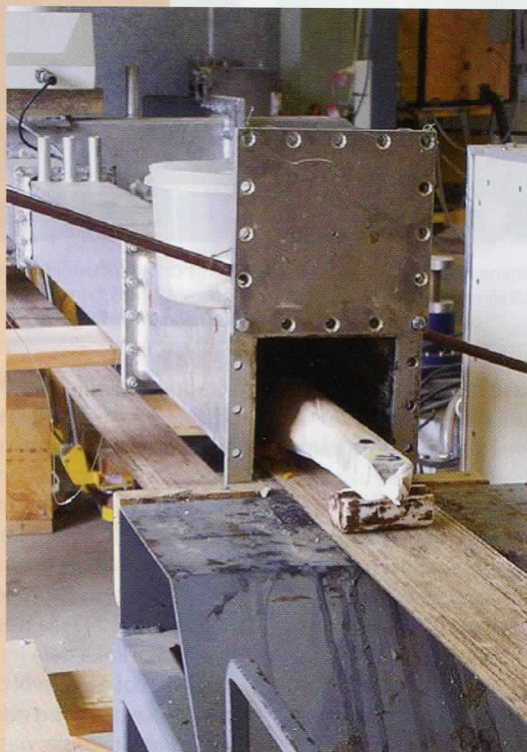
Slika 1: Komora za tretman drveta mikrotalasima velike snage

Vintorg je patentirana tehnologija koja predstavlja relativno novu vrstu modifikovanog drveta zasnovanog na tehnologiji ekspandiranja drveta putem mikrotalasa (slika 1), impregnacije lepkom, i otvrdnjavanja lepka pod pritiskom. Promenom režima tretmana mikrotalasima i pažljivim izborom lepka, moguće je proizvesti kompozit na bazi drveta koji potpuno odgovara zahtevima naručioca. Vintorg liči na prirodno drvo, ali ima veću čvrstoću, povećanu trajnost, ujednačenija svojstva, bolju dimenzionu stabilnost, i otpornost na napad gljiva i insekata. O tome smo već pisali ranije (Zdravković, DRVOtehnika br. 17, 2008).