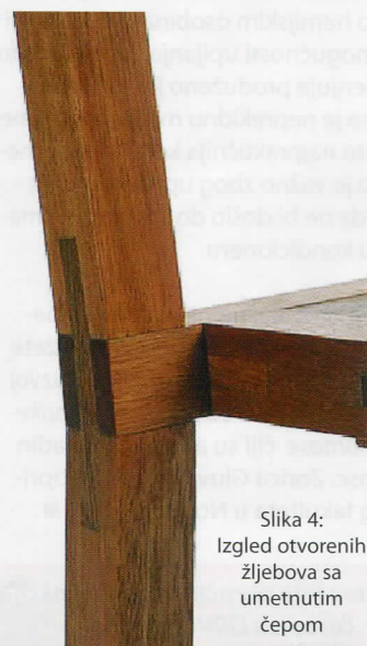
Slika 4: Izgled otvorenih žljebova sa umetnutim čepom

Primenjen je modularni princip koji pojednostavljuje proizvodnju i sklapanje stolica i stočića. Sve komponente su istog četvrtastog poprečnog preseka 25x25mm, sa otvorenim žljebom na krajevima a svi čepovi su isti i izrađuju se posebno (slika 4). Na primer, prednji zadnji nosač sedišta stolice je isti kao i delovi naslona. Kod stolice bez naslona su primenjene samo četiri komponente, od kojih se dve upotrebljavaju i za stolice sa naslonom. Ram stočića ima samo tri različite komponente.