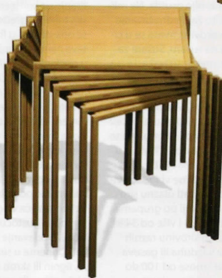
Slika 6: Rešenje slaganja stočića prilikom premeštanja i odlaganja

Modifikovano drvo Vintorg otvara nove mogućnosti u dizajnu nameštaja malih poprečnih preseka, koji su omogućeni poboljšanjem odnosa čvrstoća-težina, mogućnošću dubinskog bojenja drveta, poboljšanom trajnošću i poboljšanom afinitetu prema lepku. Iako cenovno ovakva vrsta modifikacije nije konkurentna u odnosu na metal i plastiku, ona pruža mogućnost da se istakne sve ono što je kod drveta lepo, uz eleganciju i praktičnost koju pruža laka konstrukcija. Ovom metodom moguće je u toku presovanja postići i savijene forme i druge preseke osim četvrtastog, što još više daje slobodu dizajnerima nameštaja koji bi ovakav proizvod upotrebljavali. ■