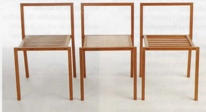
Slika 2: Izgled lake stolice od modifikovanog drveta Vintorg

Stolice napravljene od modifikovanog drveta Vintorg ne mogu po ceni da budu konkurentne stolicama od plastike ili aluminijuma, čija cena je od 5 do 10 US$, ali su isto lake i elegantne zbog malog preseka nogu i naslona, dubinski su obojene, povećana im je površinska tvrdoća i ne zahtevaju nikakvo održavanje, u smislu bojenja i lakiranja. Svi zahtevi za ovaj tip nameštaja su usklađeni sa standardima EN 581 i BS 4875. Ovakav tip stolica mora da bude lagan, da se mogu slagati jedna na drugu - što olakšava često unošenje i iznošenje a da istovremeno izdrže teške uslove eksploatacije u restoranima (slika2)