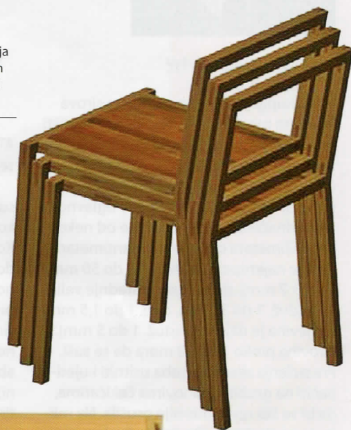
Slika 5: Rešenje slaganja stolica prilikom premeštanja i odlaganja

Vrlo bitno za ovu vrstu nameštaja i njegovu eksploataciju, pored njegove čvrstoće, otpornosti na mehanička opterećenja i atmosferilije je njihova mala težina i način njihovog slaganja prilikom čestog premeštanja. I za stolove i za stočiće to je rešenje kako je prikazano na slikama 5 i 6.