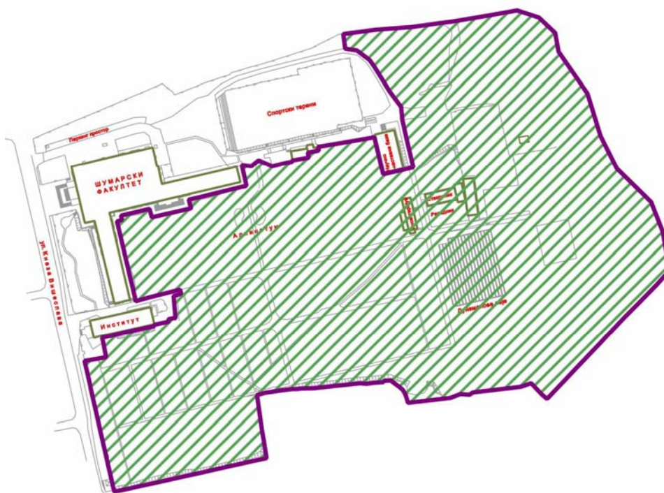
Слика 2: Граница површине заштићеног подручја које је под II степеном режима заштите, на основу Решења скупштине Београда из 2011

Границе површине које су под режимом заштите на основу Решења скупштине Града Београда из 2011. приказане су на слици 2 . Ове границе су знатно ширира од границе постојећег релативно уређеног дела Арборетума.