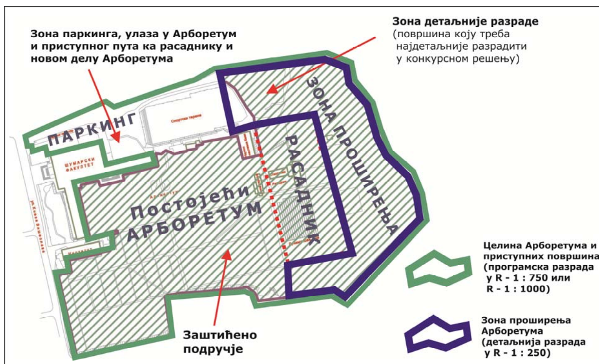
Слика 3: Границе интервенције и зоне различитог нивоа разраде конкурсног задатка